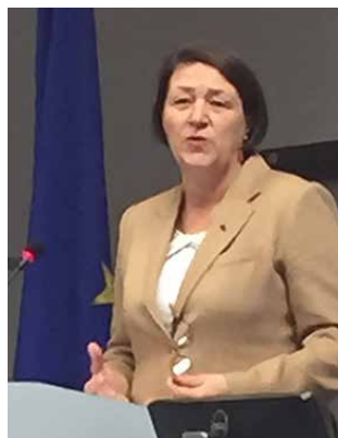
Violeta Bulc, EU-Kommissarin für Verkehr und Weltraum.

Eine Konferenz-Aufzeichnung in englischer Sprache ist unter dem obigen Link verfügbar wie auch die Präsentationen dieser Konferenz. Mehr dazu hier: https://ec.europa.eu/transport/themes/logistics/events/2018-year-multimodality-travel-information-planning-and-ticketing_en