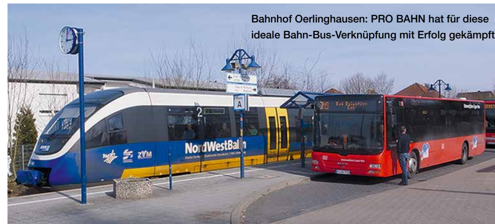
Bahnhof Oerlinghausen: PRO BAHN hat für diese ideale Bahn-Bus-Verknüpfung mit Erfolg gekämpft.

Fahrgastverband PRO BAHN stellvertretender Bundesvorsitzender